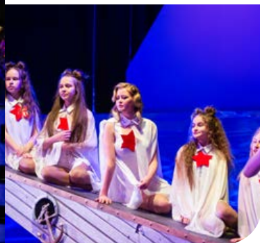
«Шпионка Сталина и Гитлера»