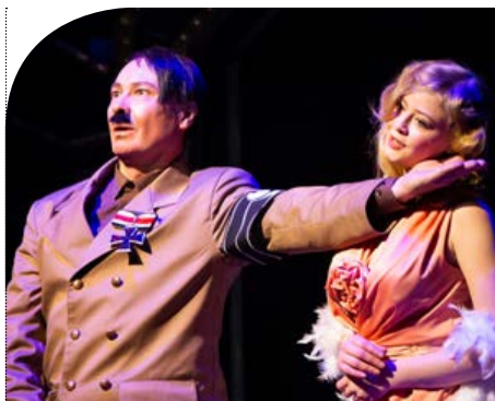
«Шпионка Сталина и Гитлера»

– Во-первых, чтобы уйти от прямой правды, ведь каждый человек примерно представляет себе, как выглядели реальные Гитлер, Сталин, Ева Браун и остальные исторические личности и будет сравнивать их с нашими актерами. А в нашем варианте ни к чему не придерешься: психически больные, люди с перевернутым сознанием начали разыгрывать какие-то сцены. И кроме того, постановка исторического спектакля стоит бешеных денег.