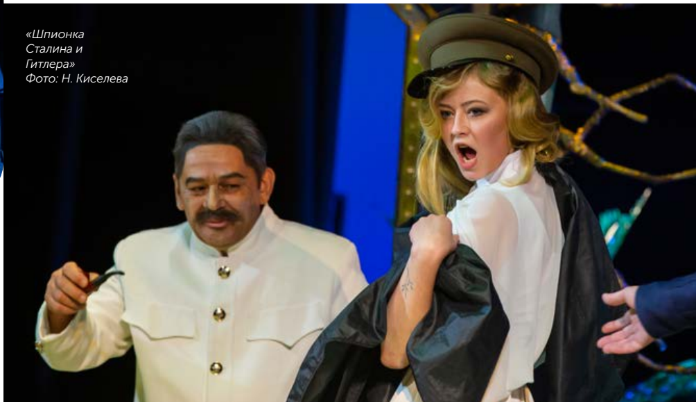
«Шпионка Сталина и Гитлера»

конечно, не все угадываешь, но, по крайней мере, понимаешь, в какую сторону пьесу можно развивать. Но главное – я написал не просто историческую пьесу. События происходят в Институте мозга, точнее в сумасшедшем доме, где больные разыгрывают спектакль.