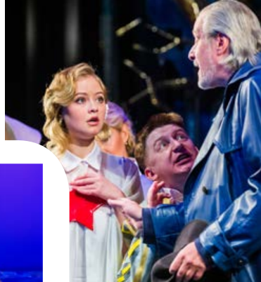
«Шпионка Сталина и Гитлера»

тамент культуры не дал нам денег на постановку, мы нашли частного спонсора, которым стал мой друг. Начали делать декорации, но тут объявили самоизоляцию, и наша работа остановилось... В общем, все было не за нас. Но тем не менее в спектакль вложено много идей и мыслей, мы справились с трудностями и выпустили премьеру.