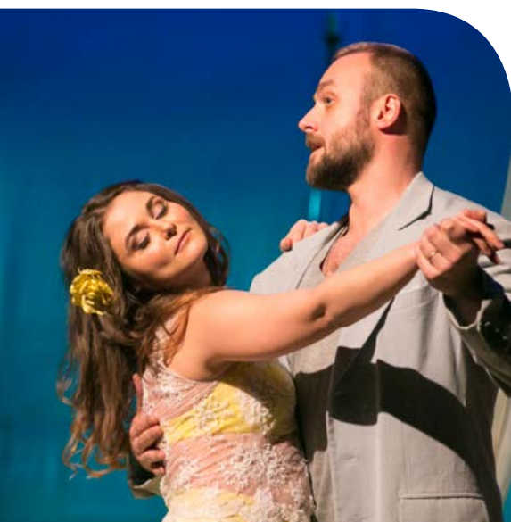
▲ «Ночь нежна»