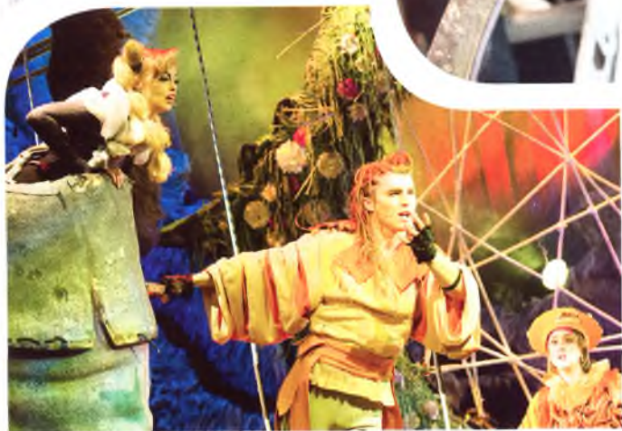
Шантеклер — Д. Воронин. «Шантеклер»