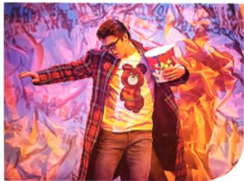
Гонсо — Д. Воронин. «Ордалии»

— Интересно, как вы решали для себя женскую роль Кормилицы?