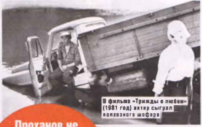
В фильме «Трижды в любви» (1981 год) актер сыграл конкозного шопера

Проханов не допускает интриг в своем коллективе. Говорит, интриганы – как моль, разлагают коллектив.