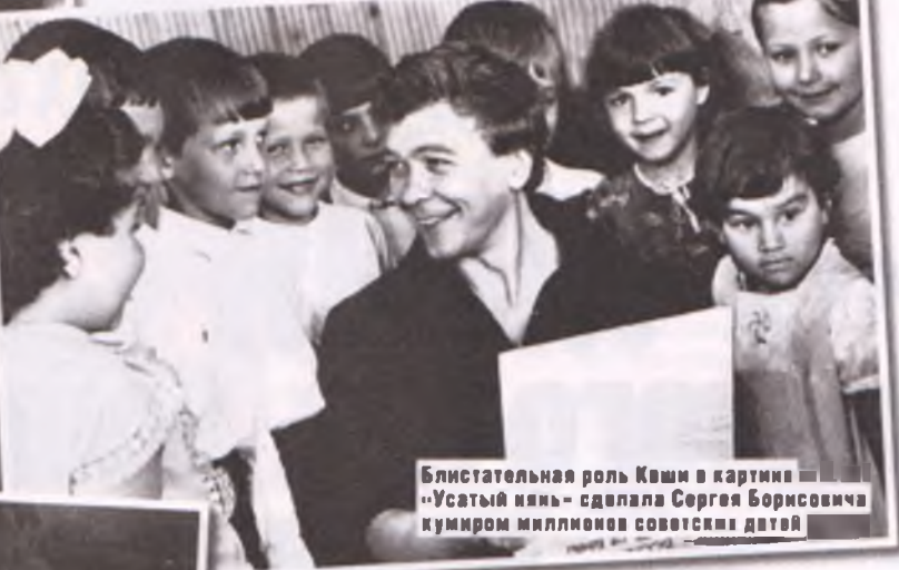
Блистательная роль Киши в картине «Усатый няня» сделала Сергея Борисовича кумиром миллионов советских детей