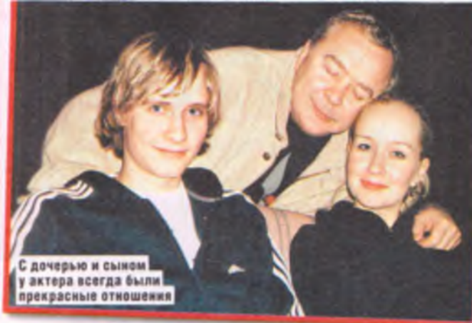
С дочерью и сыном у актера всегда были прекрасные отношения

– А если пригласить в новые постановки, сделать спектакль «под Певцова», например?