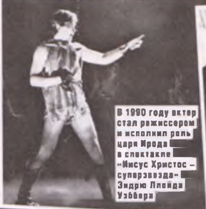
В 1990 году актер стал режиссером и исполнил роль царя Ирода в спектакле «Иисус Христос – суперзвезда» Эндру Ллойда Уэббера